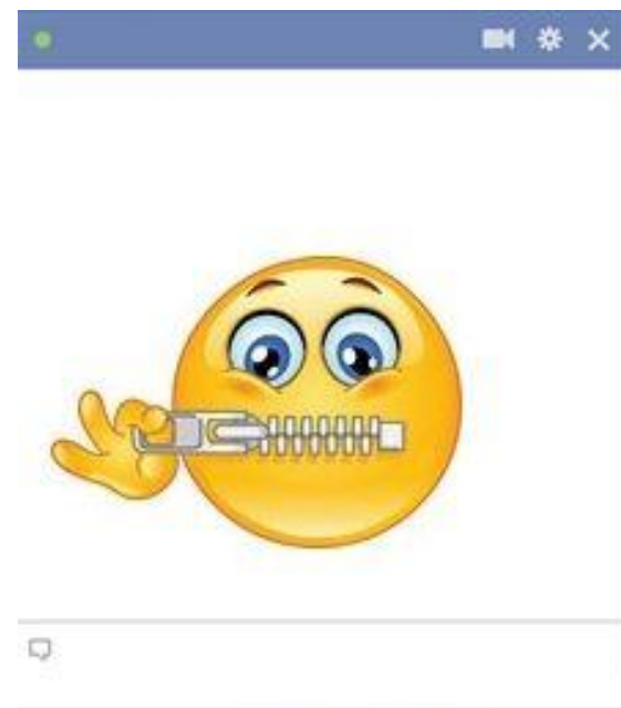
Zipping Mouth Shut